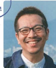
もんざえもんセンパイ

前職は印刷会社で働いていましたが、転職をきっかけにkintone管理者を引き継ぐことになりました。 いざkintoneを引き継ぐことになったとき、何から始めればいいのかさっぱり分からなかった。そもそも自分は何を引き継ぐ必要があるか、kintoneにはどんな管理者の種類があるのかを時間をかけて整理するところから始めました。 調べていくうちに、私1人のみで5つすべての管理者を担当していたということが分かったので、引き継ぎのときは、後任の方の負担や、今後の運用のことも考え、すべての管理者を1人に丸投げするのではなく、管理者の種類に応じて、適切なメンバーへ引き継ぎました。最終的には、大きな問題なく引き継ぎができたと思います。