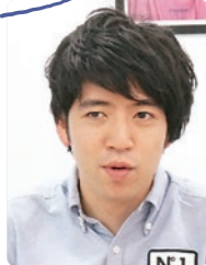
しんしんセンパイ

私も前職でkintone管理者として、kintoneを1人で運用していました。いわば会社で私だけ、kintoneに詳しい状態でしたね。 そして、異動をきっかけにkintone管理者を引き継ぐことになりました。 引き継ぎは、kintone以外の業務も含め、たった1ヶ月。 しかも、引き継ぎ相手の方はkintoneの管理・開発についての知見がなく、kintoneアプリの作成、運用中のアプリの使用シーンをつたえる必要がありました。 kintoneは最初にコツを掴むのに少し時間がかかるので、後任の方からは「別のシステムの方がいいんじゃない?」という少しショックな意見を言われてしまったことを覚えています。 今思えば、すべての種類の管理者は複数人設定できるので引き継ぐ前から権限を広げておき、時間にゆとりのあるときに、kintoneのアプリ作成方法を実際に手を動かしながら理解してもらい、kintoneの良さまで理解している仲間を増やしておけばよかったなと思います。